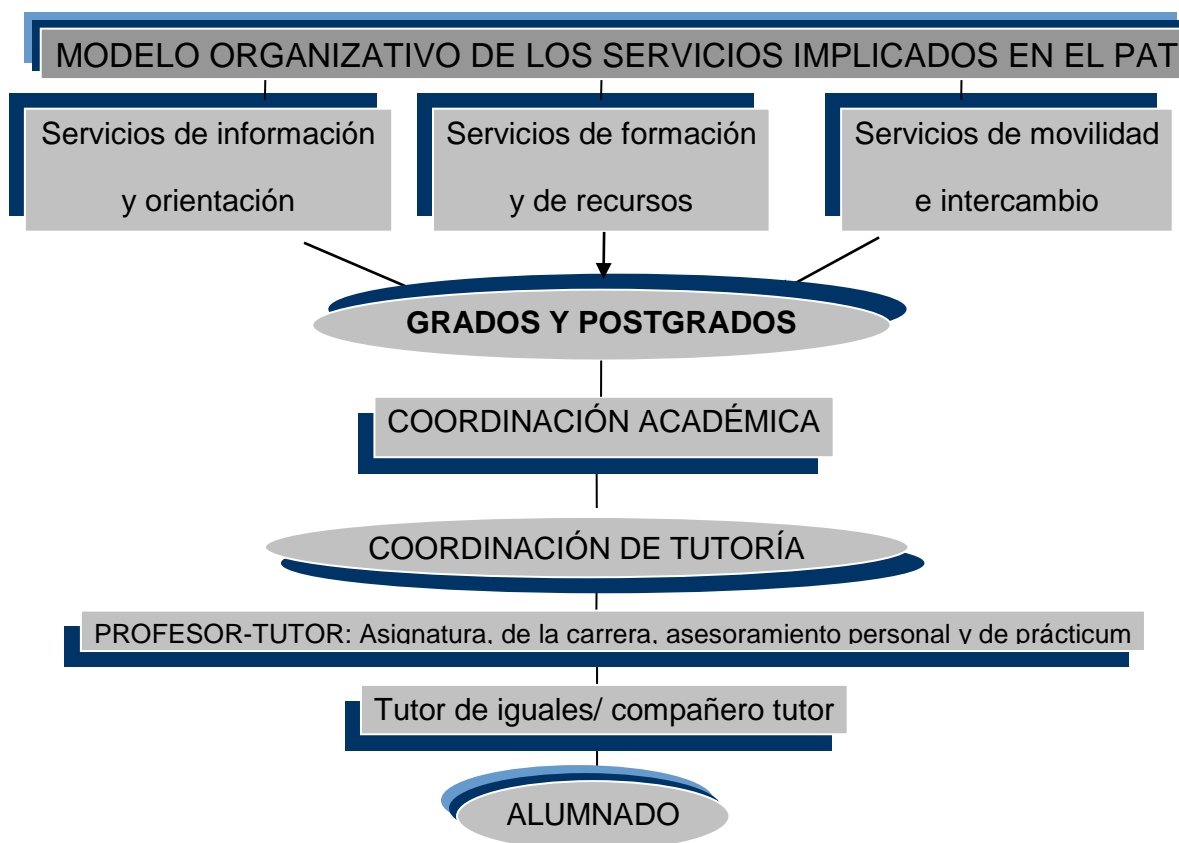
Figura 3: Modelo organizativo de los servicios implicados en el PAT

El modelo organizativo de los diferentes servicios implicados en la orientación y acción tutorial, queda estructurado de la siguiente forma (Figura 3):